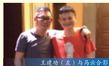
王建功（左）与马云合影

6月7日，华谊兄弟传媒集团在海南海口举行盛大的20周年庆典，作为亚洲品牌协会副主席单位，华谊兄弟盛情邀约协会常务秘书长王建功赴约盛典。盛典之际，华谊兄弟股权持有人之一阿里巴巴集团始创人马云与协会常务秘书长王建功进行了亲切的会面交谈，并拍照留念。王建功常务秘书长亲切邀请了马云出席第九届亚洲品牌盛典。