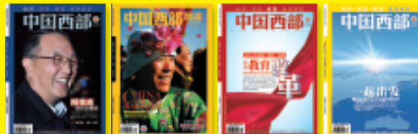
《中国西部》经济刊 | 《中国西部》旅游刊 | 《中国西部》教育刊 | 《中国西部》教学研究刊

中国西部报道网站：www.chnwest.cn 中国西部官方微博：weibo.com/westernchina 中国西部官方微信：chnwest